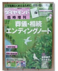
ダイヤモンド社 エンディングノート抜粋

葬儀について（自分の希望するところ、規模など） 葬儀費用はどうまかなうか（貯金や資産から、互助会掛金などから、家族に任せたいなど） 葬儀の宗派・葬儀の世話役について（喪主、葬儀業者について、祭壇飾り、香典返しについてなど） 遺影・戒名について（希望の写真、保管場所） 装束や副葬品について（和装や洋服、入れて欲しい物がある、特になしなど） 開催礼状・礼品について（返礼品の希望品、家族の判断に任せるなど） お墓・納骨について（先祖代々のお墓へ納骨、お墓の購入、散骨の希望など） 供養・法要の予算・費用（準備してもらう人の名前、遺産から法費用に取り分けるなど）