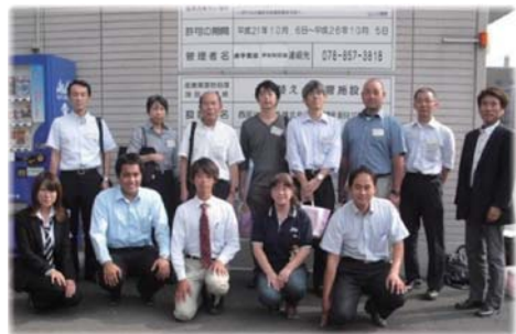
平成25年9月11日 西部サービス㈱神戸工場