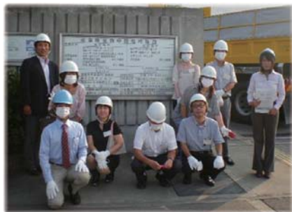
平成25年9月12日 (株)ダイカン堺事業所