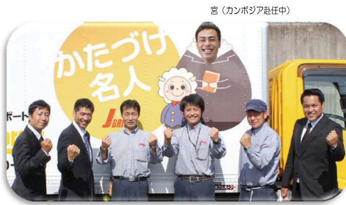
宮(カンボジア赴任中)

遺品整理に伴う細かな分別作業や、搬出作業まで全て弊社で行わせていただいております。その他にも、『ライフサポート』として、ハウスクリーニングや害虫駆除、剪定作業なども行っていますので、些細なことでも“お困りごと”がございましたらお気軽にお問い合わせ下さい。