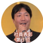
社員表彰 第 3 位