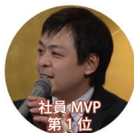
社員 MVP 第 1 位