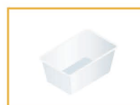
プラスチック容器