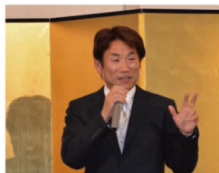
第1部は1年の振り返り