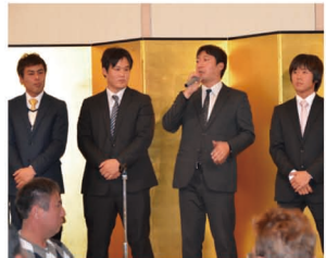
チームごとに目標を発表