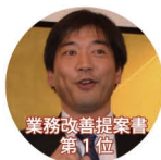
業務改善提案書 第 1 位