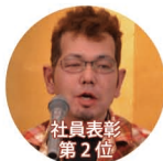
社員表彰 第 2 位