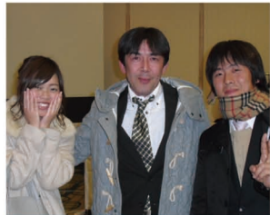
現場スタッフと事務員

平成 29 年 1 月 7 日 (土) ホテル京阪にて、J-GROUP 社員総会を実施しました。