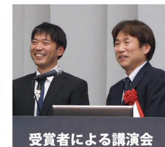
受賞者による講演会