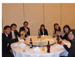
第2部はみんなで乾杯