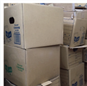
クリアファイルに綴じられている書類