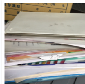
箱詰めされている書類