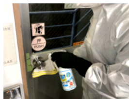
玄関扉・取手類の除菌

菌と直接触れる原因になる手すりや机など、人の手が触れる箇所は重点的に除菌いたします。また、机のヘリや裏側などの人の手が触れるが見落としがちな所も逃さず除菌いたします。