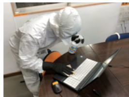
オフィス機器の除菌