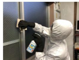
窓ガラス(内側)の拭き除菌