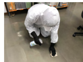
床orカーペットの除菌処理