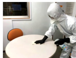
デスク・テーブルの除菌