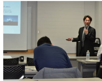
知って得する産廃セミナー