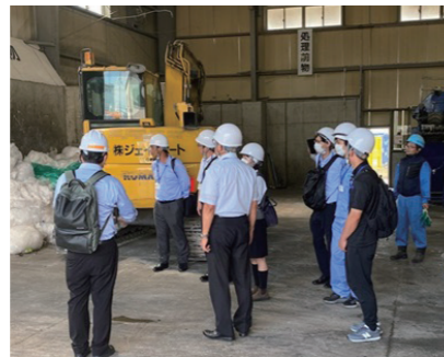
現地見学・講習会

廃棄物に関する分別や法律等、お客様のニーズに合った内容で出張セミナー等を行っています。社内ではお客様によりよいサービスを提供させていただけるよう週4回、早朝勉強会を行っています。現地見学・講習会は法律によって「努力義務」とされており、弊社では2ヶ月に1度のペースで実施しています。弊社処分場や搬入先の処分場を実際に見ていただき、信頼性とコンプライアンスを確認いただいています。ご興味がおありの方は一度お問合せください。