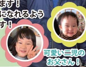
可愛い三男のお父さん!